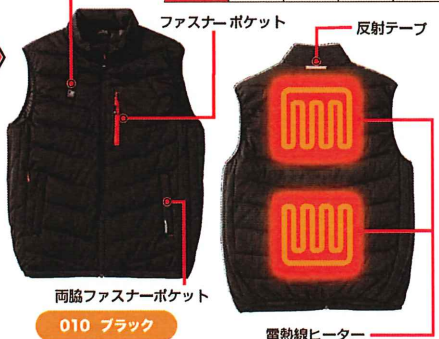
両脇ファスナーポケット 010 ブラック