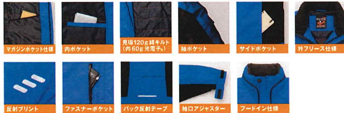
マガジnpocket仕様 内ポケット 厚綿120g絨キルト(内60g光電子 ® ) 胸ポケット サイドポケット フリース仕様