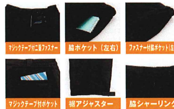
マジックテープ付ジッパー 脇ポケット(左右) ファスナー付脇ポケット(左)